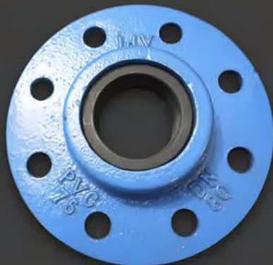
Extremo bridado para adaptar Brida PVC DN 63 / 75